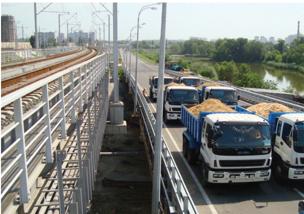
Випробування мостового переходу через Дніпро