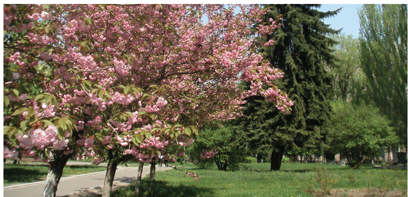
Весна в ДНУЗТ: алея сакур

У 2014 році заплановано підвищення кваліфікації на базі ВНЗ I-IV р. а. 11 922 керівних працівників та фахівців залізниць, а також проведення підготовки 1415 робітників, перепідготовки — 5091 та підвищення кваліфікації — 26 537.