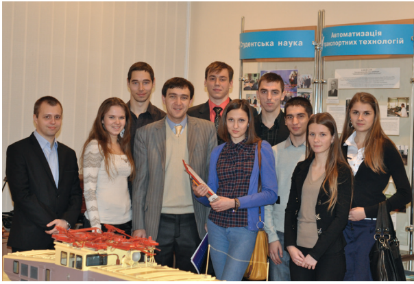
Рада Студентського наукового товариства