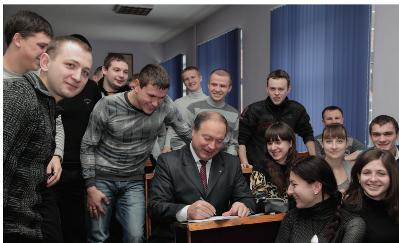
Ректор університету із студентським активом

У структурі університету 10 факультетів, де навчаються понад 12 тис. студентів за 24 спеціальностями. Заклад має філію у Львові, 20 філій кафедр у різних містах, де майбутні фахівці поглиблюють свої знання, а також