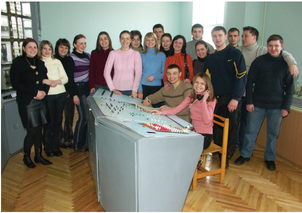
Лабораторія руху поїздів