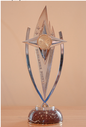
Нагорода ДНУЗТ — «Визнання року 2012»